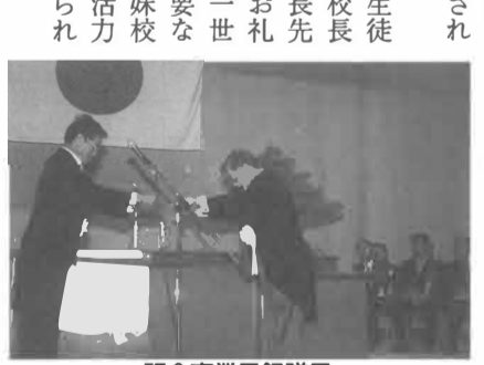
記念事業目録贈呈