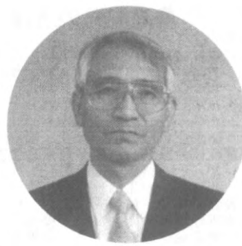
フルンネ デルタ カレッジと 姉妹校提携

本校同窓生の皆様には、ご卒業後、ご活躍の場を問わず、ご支援とご協力をお願いいたします。また、ご卒業後、ご活躍の場を問わず、ご支援とご協力をお願いいたします。