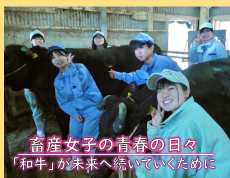
畜産女子の青春の日々 「和牛」が未来へ続いていくために